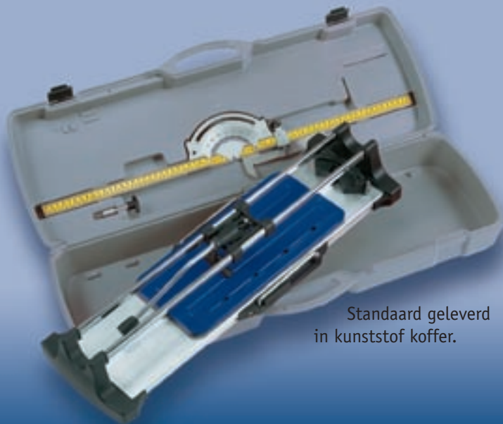
Standaard geleverd in kunststof koffer.