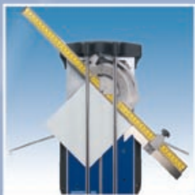
Aanslag voor het snijden onder elke gewenste hoek.