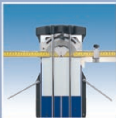
Maatverdeling voor het exact instellen van rechte en diagonale zaagsneden.